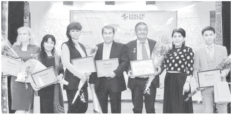
29 октября 2019 года г. Алматы