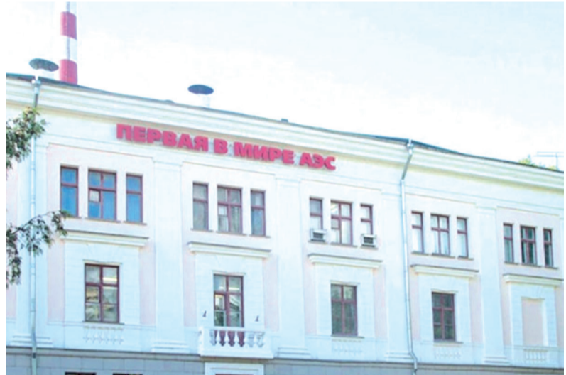
мұражайы құрылды. Обна реакторынан кейін 1956 жылы Ұлыбритания өзінің

атом электр станциясы орналасқан. Бельгия, Финляндия және Словакиядағы бес реактор. Швейцарияда, Венгрияда, БАӨ - 4, Аргентинада - 3 реактор. Бразилияда, Болгарияда, Мексикада, Румынияда, Оңтүстік Африкада және Беларусьта екі реактор және Словенияда, Арменияда, Нидерландыда және Иранда бір реактор бар. Коммерциялық атом электр станцияларынан басқа, 50-ден астам елде 220-ға жуық зерттеу реакторлары жұмыс істейді. Ғылыми зерттеулер мен оқытуда қолданудан басқа, бұл реакторлардың көпшілігі медициналық және өндірістік изотоптар шығарады. Германия 2023 жылға дейін атом энергиясын өндіретін елдердің қатарында болды, бірақ кейін атом электр станцияларынан мүлдем бас тартты. Былтыр 15 сәуірде елдегі соңғы үш Атом реакторы - Бавариядағы Isar 2, Төменгі Саксониядағы Emsland және Баден-Вюртембергтегі Neckarwestheim 2 - желіден ажыратылды.